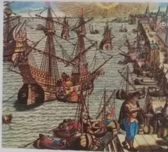
Durante el siglo XV, los puertos europeos sobre el Atlántico tuvieron una intensa actividad.

Por último, la curiosidad y el deseo de obtener fama y fortuna contribuyeron a que muchos hombres participaran en arriesgados y peligrosos viajes interoceánicos.