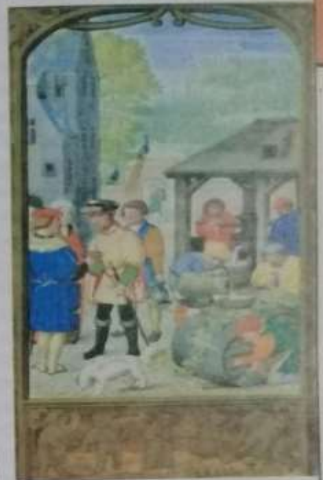
Mercaderes y trabajadores en una ciudad medieval del siglo XV.

El tránsito hacia nuevos modos de organización económica, social y política fue debilitando lentamente los fundamentos del orden feudal europeo. Sin embargo, las continuidades entre la época moderna y la medieval fueron muchas: en la sociedad rural persistieron las relaciones feudales; la mayor parte de la población siguió viviendo en el campo, ajena a las nuevas ideas, y la nobleza se mantuvo como el grupo más poderoso de la sociedad europea.