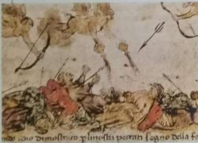
Una alegoría sobre la epidemia de peste negra que asoló Europa.

Al hambre y la peste se sumaron las guerras que los reyes y los señores feudales sostuvieron para ampliar sus territorios o establecer sus límites. La más larga y costosa fue la Guerra de los Cien Años , en la que se enfrentaron los reinos de Inglaterra y Francia. Las guerras trajeron más muertes, la destrucción de los cultivos, el aumento del gasto de los Estados y el incremento de los impuestos y las cargas feudales sobre los campesinos. El orden feudal entró en una etapa de profunda crisis.