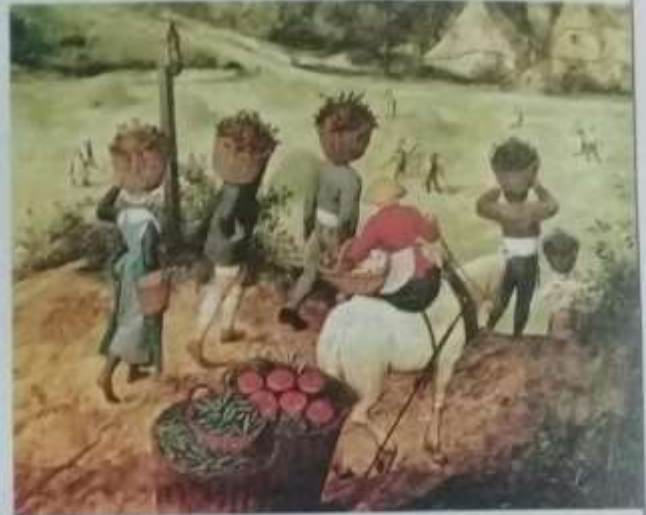
Campesinos trabajando en la cosecha durante el verano, según una pintura de Abel Grimmer.

A partir del siglo XIII, los reyes comenzaron a recuperar la autoridad que habían perdido frente a los nobles y crearon nuevas instituciones de gobierno: