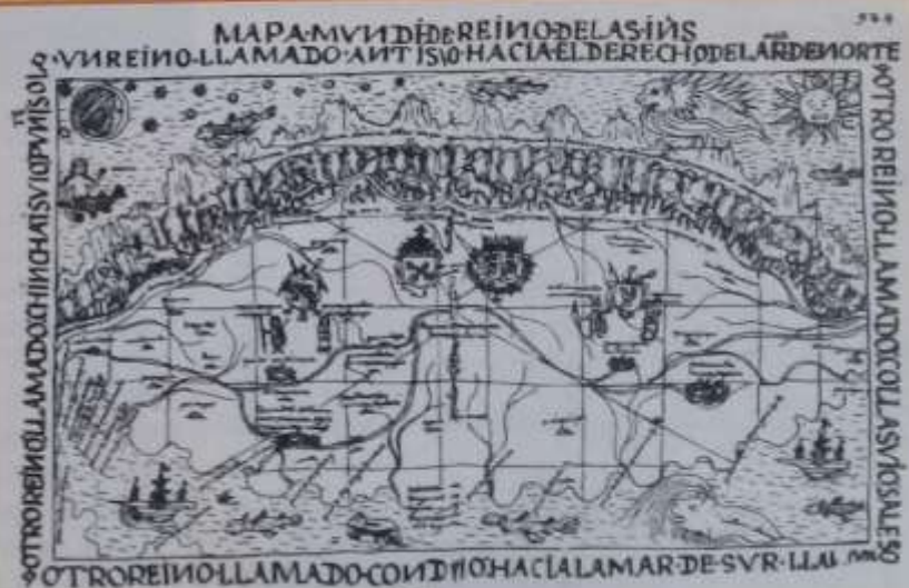
Representación del mundo hacia el 1600, realizada por el cronista inca Guamán Poma de Ayala.

Los historiadores de los siglos XVIII y XIX interpretaron las transformaciones ocurridas en Europa desde finales del siglo XV como una profunda ruptura del orden medieval. Por esta razón, en la periodización de la historia de Occidente que elaboraron, llamaron Edad Moderna al período comprendido entre el siglo XV y fines del XVIII. Los hechos tomados como referencia para marcar el comienzo de la Edad Moderna fueron la caída de Constantinopla en poder de los turcos, en 1453, y la llegada de los españoles a América, en 1492. Para marcar su finalización, consideraron el comienzo de la Revolución Francesa, en 1789.